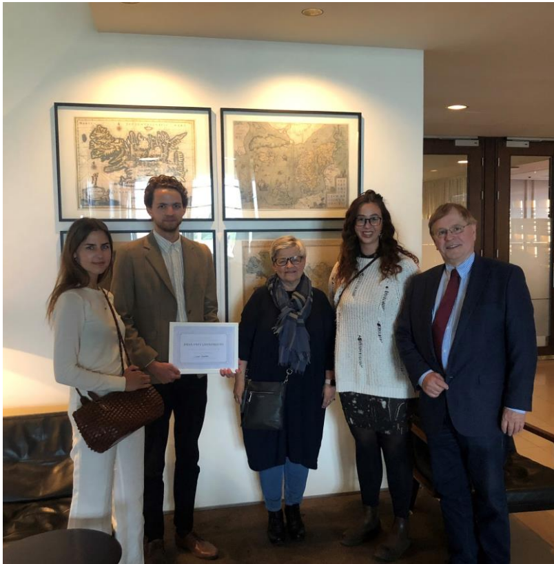
Frá afhendingu styrksins 13. ágúst 2018.

Næsta úthlutun úr sjóðnum verður 13. ágúst 2020.